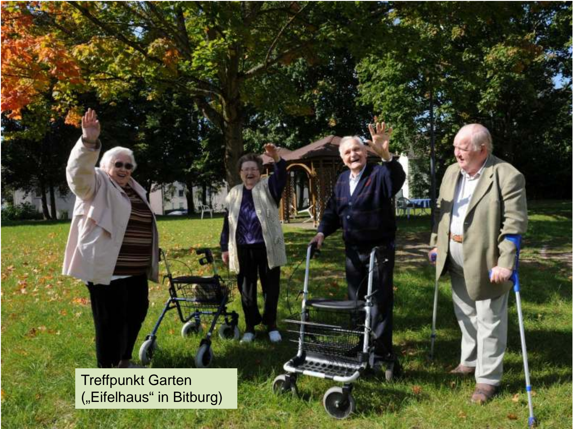
Treffpunkt Garten („Eifelhaus“ in Bitburg)