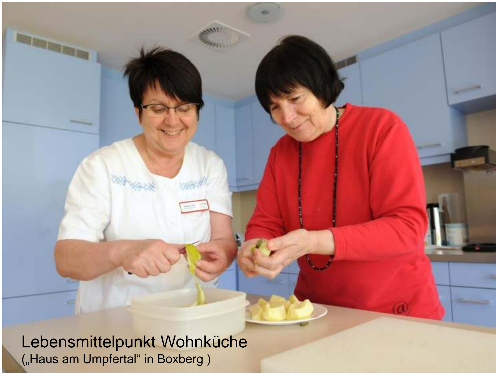
Lebensmittelpunkt Wohnküche („Haus am Umpfertal“ in Boxberg )