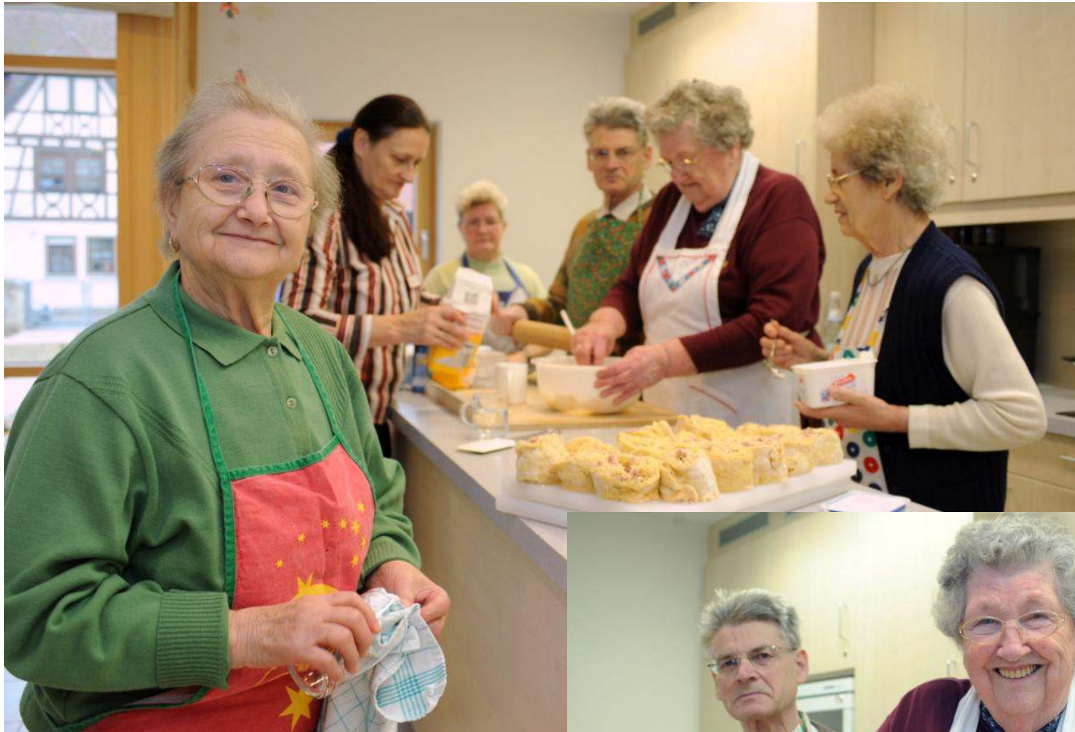
Lebensmittelpunkt Wohnküche („Haus St. Josef“ in Königheim )